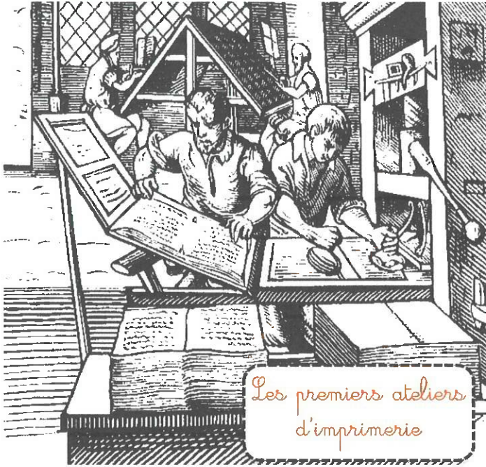
Les premiers ateliers d'imprimerie

Jusqu'au xve siècle, les livres étaient écrits à la main. Le travail était lent et les copies peu nombreuses, aussi les manuscrits étaient-ils rares et chers.