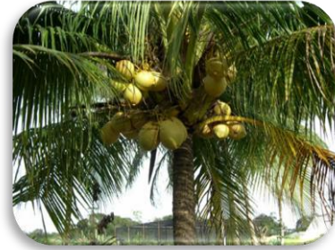
La noix de coco