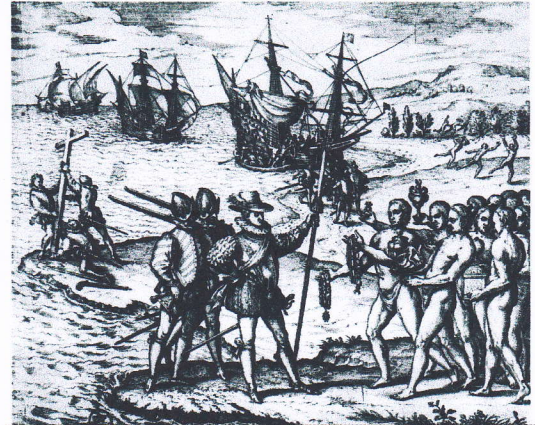
Arrivée de Christophe Colomb en Amérique – gravure, XVIème siècle

D'après G. Eanes de Azura, Chronique de la découverte de la Guinée, XVIème