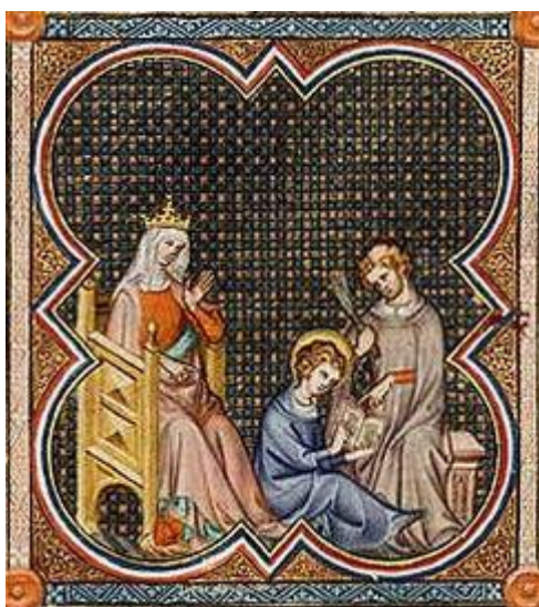
Leçon de lecture de Saint Louis, Grandes Chroniques, XIVe siècle