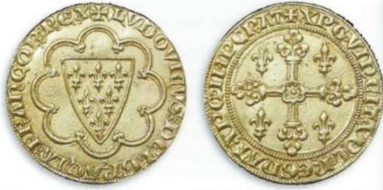
Monnaie d'or de Louis IX (face et revers de l'écu d'or), 1270

JEAN DE JOINVILLE, Vie de saint Louis , début du XIV e siècle.