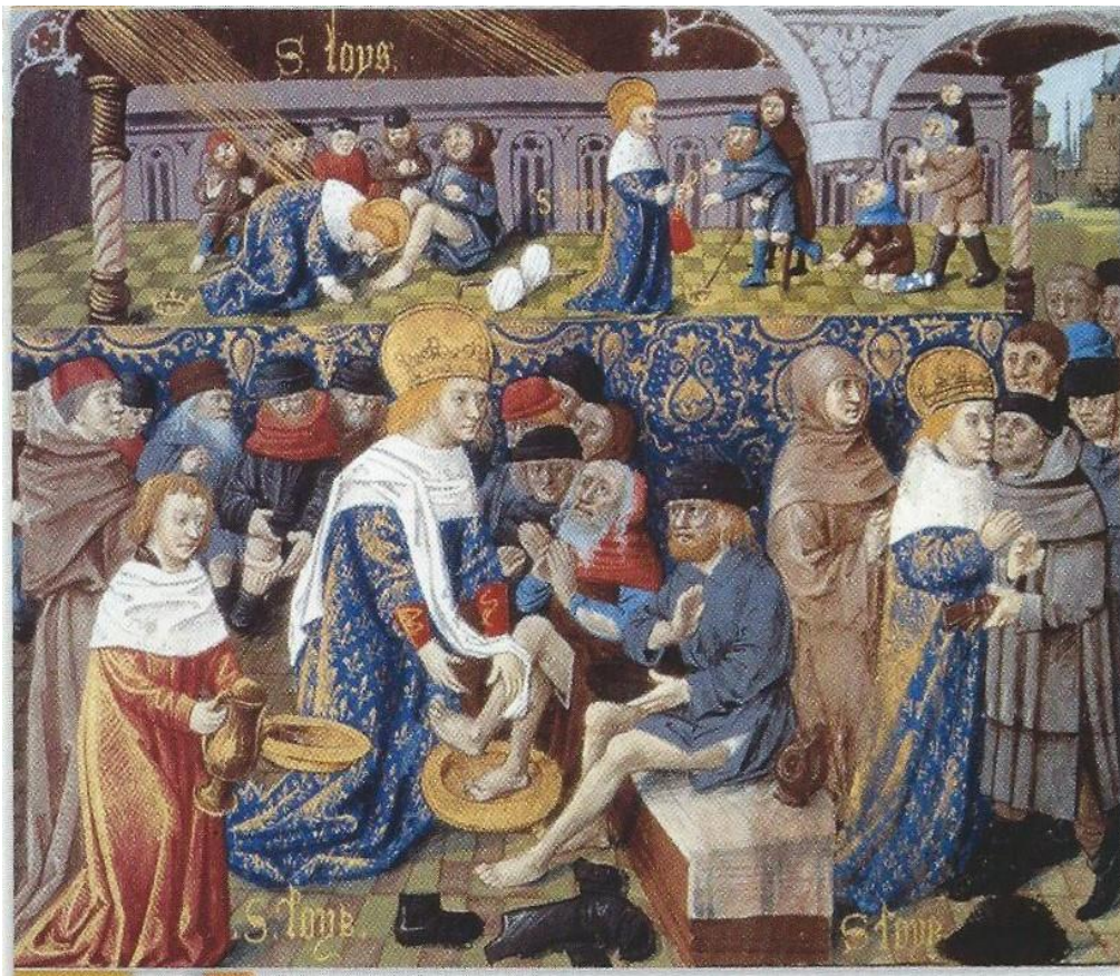
Saint Louis s'occupant des pauvres, miniature, XVème siècle.

Louis IX appartient à cette catégorie de personnages historiques dont le souvenir s'entoure d'images familières et touchantes ainsi que d'anecdotes et de légendes édifiantes. Qui, en effet, n'a pas entendu parler de ce roi juste et bon que Joinville, le chroniqueur du règne, le confident et l'ami du souverain, nous a décrit simplement vêtu, coiffé d'un chapeau orné d'une plume de paon blanc, écoutant les plaintes de ses sujets ou rendant la justice sous un chêne à Vincennes ? Dans ces conditions, il n'est pas toujours aisé de faire la part entre légende et vérité. Il est incontestable cependant que Saint Louis eut à cœur d'être un roi « très chrétien ». On sait par exemple qu'il lui arrivait fréquemment de recevoir à sa table certains pauvres et, après leur avoir servi lui-même la viande et le pain, de les reconduire en leur faisant don de quelques deniers. On sait aussi qu'il assistait quotidiennement aux offices religieux, s'habillait toujours simplement et que, afin de soulager la misère des aveugles, il fit construire pour eux l'hôpital des Quinze-Vingt.