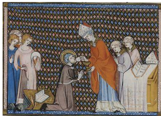
Communion de Louis IX, Vie et miracles de Saint Louis, G. de St. Pathus, XIVe siècle.