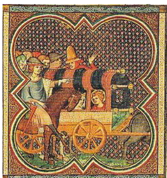
Louis et sa mère allant à Reims, id. XIVe siècle.

Né le 25 avril 1214 à Poissy, 44e roi de France, et neuvième issu de la dynastie des Capétiens directs, il est le cinquième enfant et quatrième fils connu du roi Louis VIII, dit « Louis le Lion » et de la reine Blanche de Castille, de laquelle il reçoit une éducation très stricte et très pieuse durant toute son enfance. Aîné des membres survivants de sa fratrie, il hérite de la couronne à la mort de son père, alors qu'il n'est âgé que de douze ans. Il est alors sacré le 29 novembre 1226 en la cathédrale de Reims, mais c'est la reine mère qui, conformément au testament de Louis VIII, exerce la régence du royaume jusqu'à la majorité du nouveau monarque.