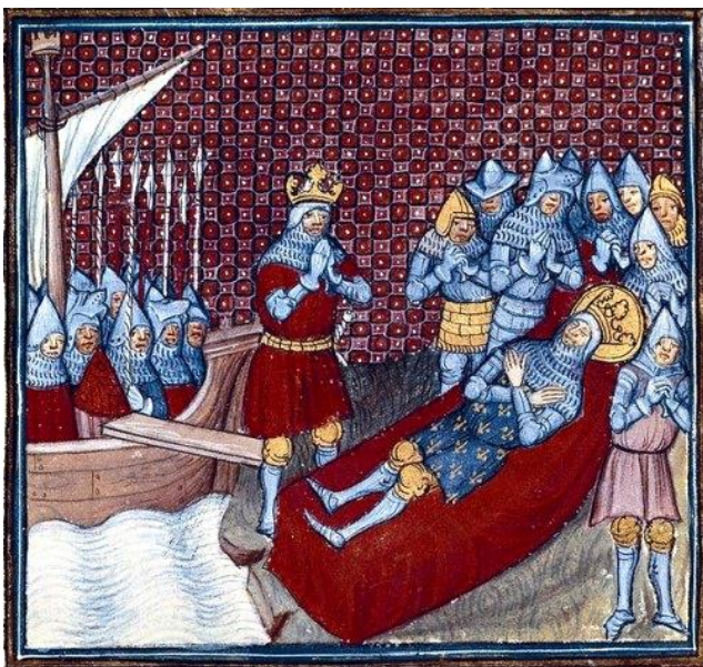
La mort de Saint Louis

Les échecs des croisades et la mort du roi signeront la fin des croisades pourtant commencée en 1095 suite à l'appel du pape Urbain II.