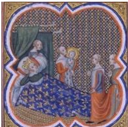
Naissance de Louis IX, Grandes Chroniques de France de Charles V, XIVe siècle.